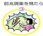
前兆現象を見たら