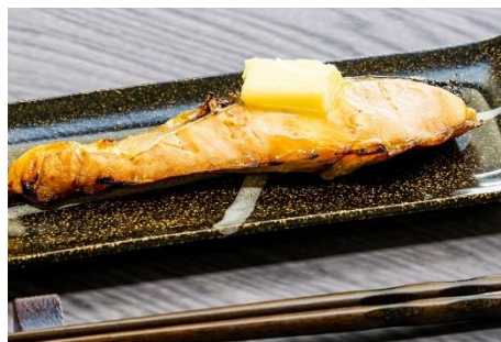
鮭&バターセット 寄附金額 ¥24,000 円から