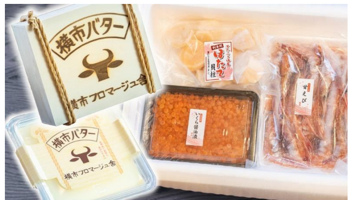
横市バターと甘えび・ほたて・イクラのセット 寄附金額 ¥29,000 円から