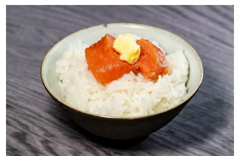
明太子&バターセット 寄附金額 ¥21,000 円から