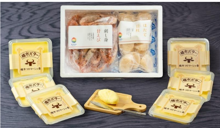
横市バターと甘えび・ほたてセット 寄附金額 ¥24,000 円から