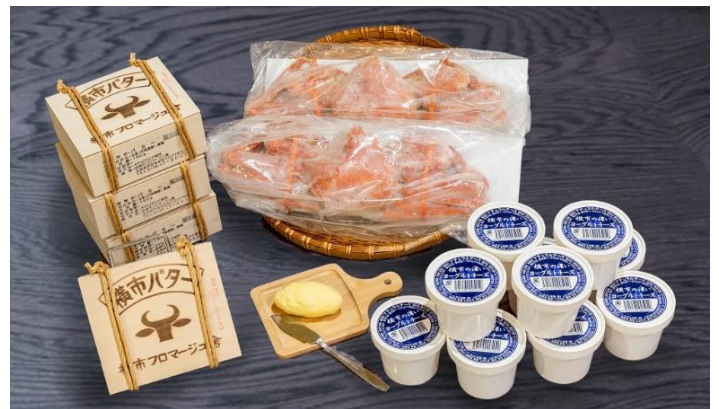
横市バター・ヨーグルトチーズとずわい蟹セット 寄附金額 ¥45,000 円から