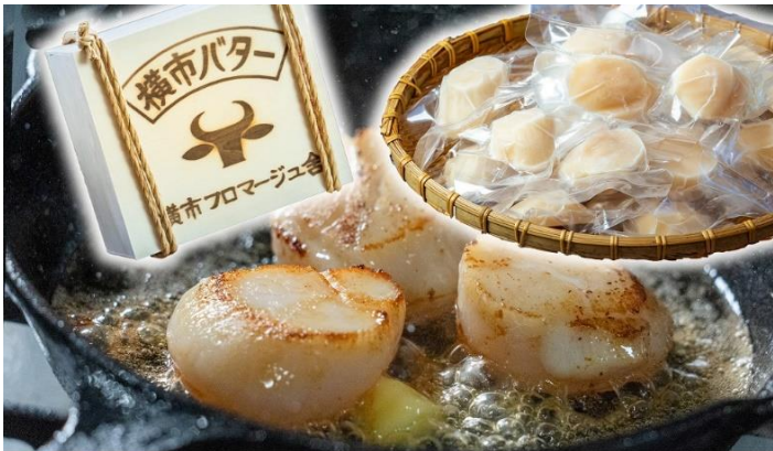
横市バターと北海道産ホタテのセット 寄附金額 ¥26,000 円から