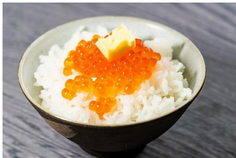
いくら&バターセット 寄附金額 ¥25,000 円から