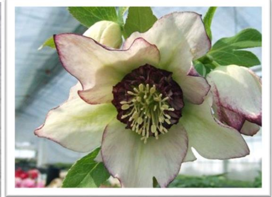
石黒花園 クリスマスローズの発送について