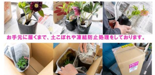
お手元に届くまで、土こぼれや凍結防止処理をしております。