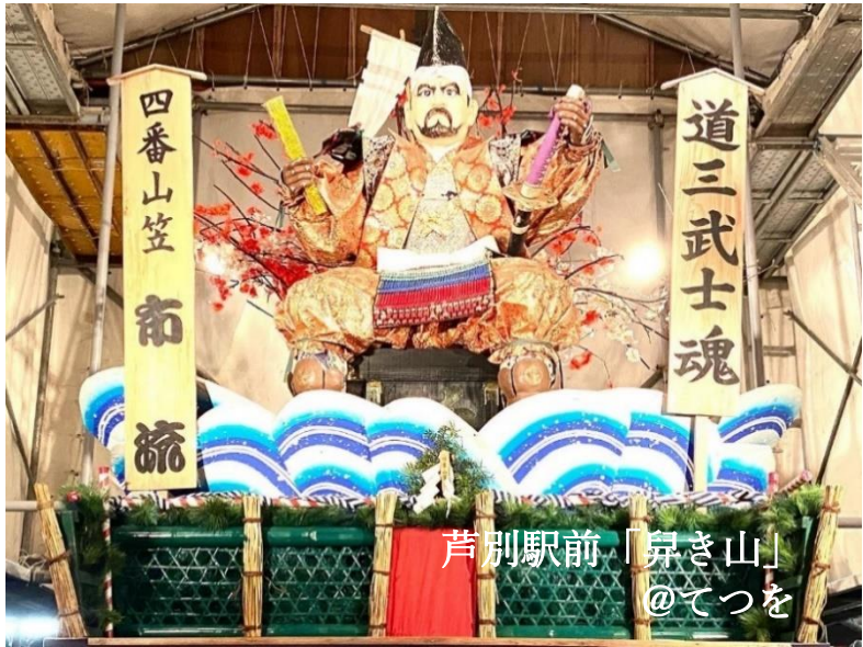
芦別駅前「昇き山」

■発行 芦別市 商工観光課ふるさと納税推進係 (☎0124-27-7086) / (一社)芦別観光協会 (☎0124-23-1437)