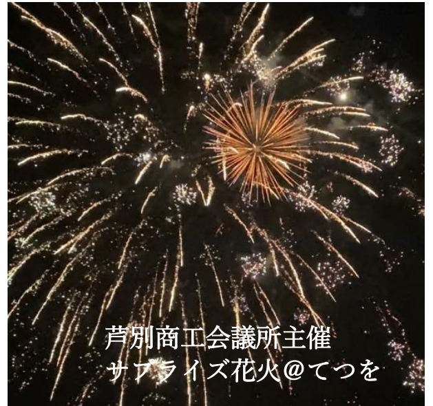
芦別商工会議所主催 サプライズ花火@てつを

新型コロナウイルス感染症が第7波として広がりを見せており、本市では、山笠や千人踊りで賑わいを見せる「健夏まつり」やレーザー光線と花火のショー「キラキラフェスタ」といった夏のイベントが3年連続の中止となりました。そのような中「健夏山笠」事業の一環として、地域の方々の無病息災、疫病退散、特にコロナ終息を祈願した市内4か所での「昇き山」の公開展示や、芦別商工会議所によるサプライズ花火の打ち上げ等が行われ、夏を感じる一幕がありました。