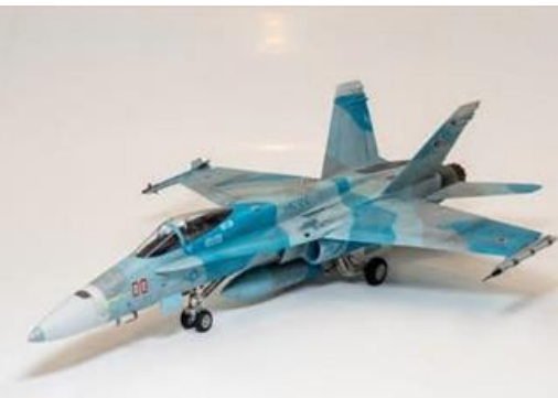
プラモデラーPOOH 熊谷 (完成品)F/A-18C ホーネット