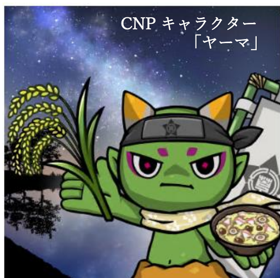
CNP キャラクター 「ヤーマ」

「NFTによる地方創生」を推進する(株)あるやうむ〔本社：札幌市〕が提供するデジタルアート返礼品企画「ふるさとCNP (クリプトニンジャパートナーズ)」を、道内では余市町に次ぐ2番目、全国で5番目の自治体として本市が採用し、12月16日から返礼品として提供開始します。