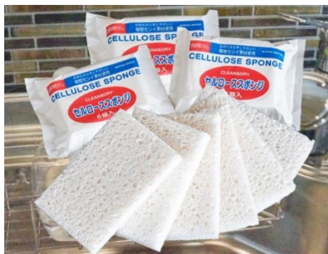
ネット通販で大人気! 植物由来のセルローススポンジ

この時期は、ふるさと納税の駆け込み時期となりますが、人気の芦別米はもちろんのこと、日用品や唯一無二の逸品、そして芦別で使える温泉利用券等、豊富に取り揃えていますので、ポータルサイトをチェックしてくださいね。