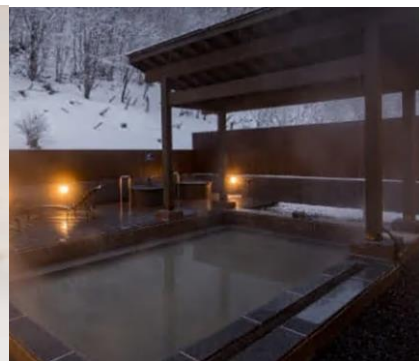
芦別温泉おふろ café「星遊館」 フリータイム入館券