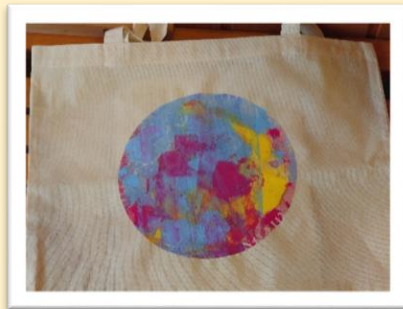
↑ 文字までくっきり！ きれいに塗れました～♪