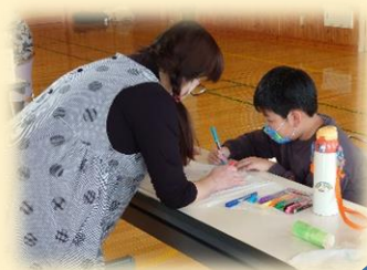
↑ お絵描きで筆が進まないときは、 先生と一緒にデザインを考えてくれますよ♪