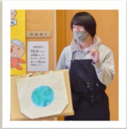
↑ 講師の先生の見本