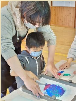
← 講師の先生が 優しく 手伝って くれました (*^ ^*)