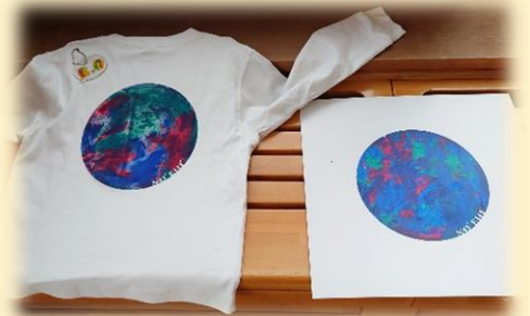
↑ おうちから持ってきた T シャツに 色を塗った人もいました☆彡