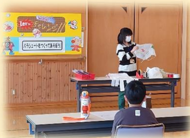
↑ まずは講師の先生の見本

ビニール袋でパラシュートをつくって、高いところから落ちたところをキャッチしました！