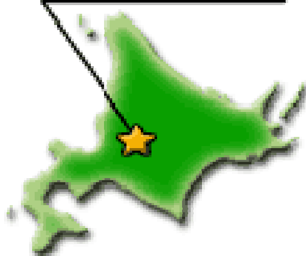
芦別市の気温と降水量