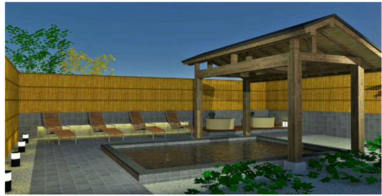
■露天風呂イメージ