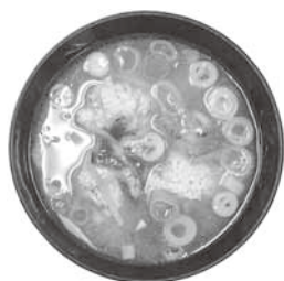
1人分のカロリー【194Kcal】

きのこの食物繊維、ビタミン、ミネラルは、途中で消化吸収されずにそのまま腸の免疫細胞に作用し、免疫力を高めてくれます。