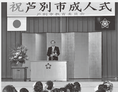
1月13日、青年センターで芦別市成人式に出席し、祝辞とエールを贈らせていただきました