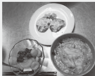
■簡単クッキングメニュー ■韓国風おじやサムゲタン ■しいたけのグラタン ■かぼちゃ白玉のフルーツポンチ