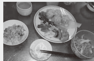
▲ヘルシークッキングメニュー ■青葉とツナの混ぜご飯 ■芦別産もち米シューマイと2種のお楽しみソース ■あさりときのこのポカポカスープ