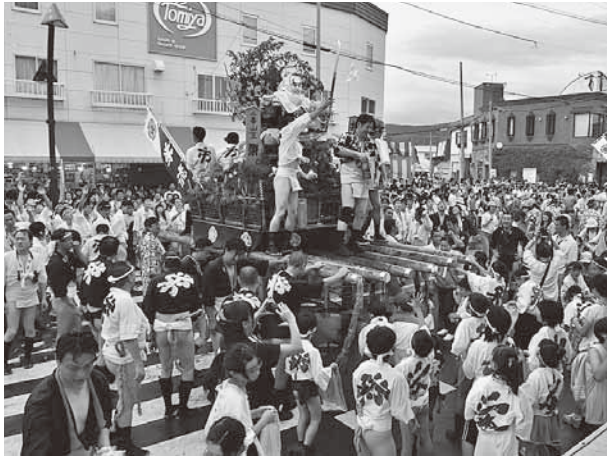
無事に走り終え、恒例のもちまき「栄流」