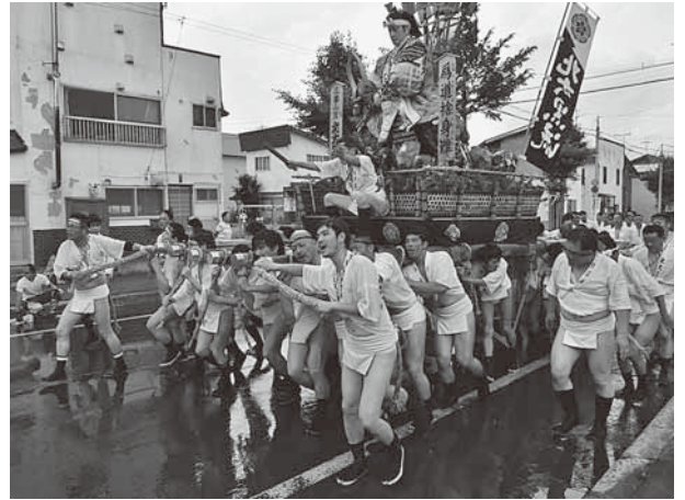
最後の力を振り絞る「北大黒流」