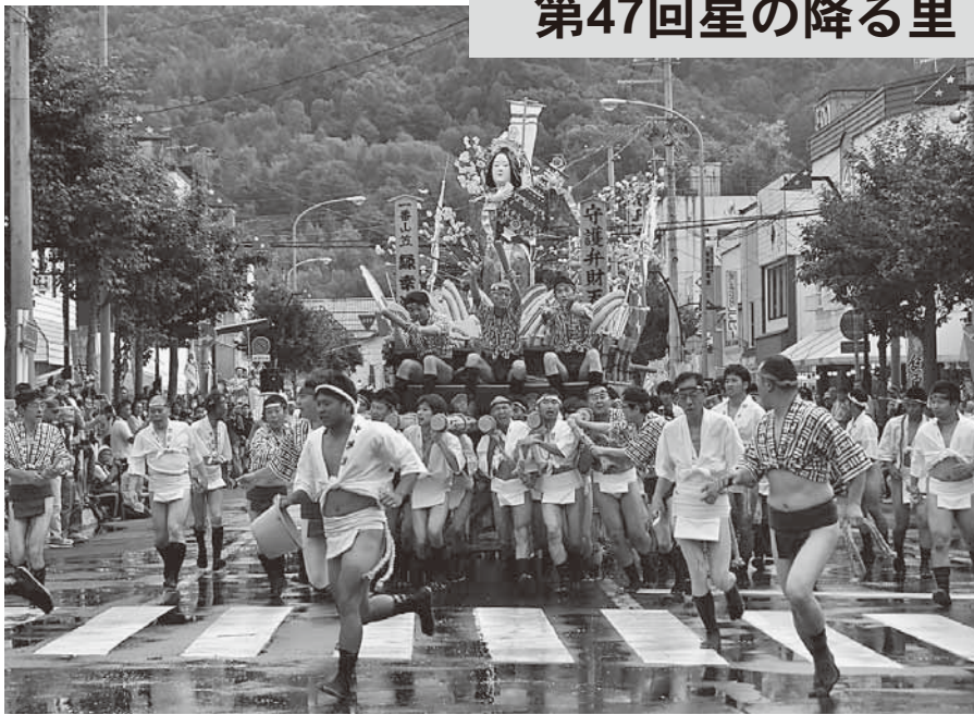
昨年に続き「一番時計」(タイムレース1位)となった「緑幸流」

7月16日と17日の2日間にわたって「星の降る里・芦別健夏まつり」が開催されました。初日は晴天に恵われましたが、2日目の午後から雨に見舞われ、残念ながら「千人踊り」は中止に。それでも、初めて行われた「さくらんぼ種飛ばし大会」などには多くの子どもたちが参加するなどにぎわいを見せました。