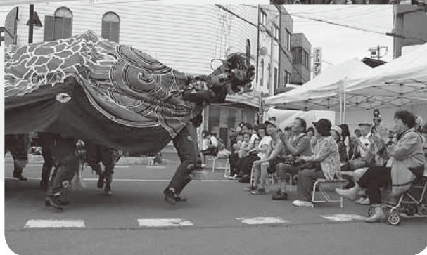
市民の皆さんの無病息災を願って「芦別獅子」