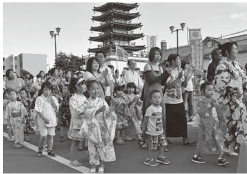
学校、サークルなど ●申し込み・詳細 健康まつり実行委員会(市観光振興係)

健康まつり千人踊りに参加しませんか 4年連続の千人超えを目指し、まつりをより盛り上げるため、千人踊りの参加者を募集しています。近所、ご家族お誘い合わせのうえ一人でも多くの方のご参加をお待ちしています。 ○日時 7月19日(日)午後4時～5時(予定) ○会場 健康まつり会場(芦別駅前通) ○申込期限 6月19日(金) ○対象 個人・団体(職場、