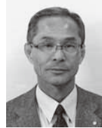
昭和49年 7月芦別市消防署消防士に任命され、その後、平成8年には、芦別市消防本部・署、初の救急救命士となり、平成10年に消防署救急救助係長に任命されました。

以後、平成13年消防署警防第2課長、さらに警防第1課長を歴任し、平成17年からは芦別市消防本部次長兼署長に昇格、平成19年に芦別市消防長に就任しました。