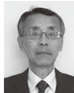
○任期 4月1日～平成29年3月31日 ○連絡先 ☎22・8745

※行政相談委員は、皆さんと国の役所のパイプ役となり、業務への苦情や要望などを受け付けます。なお、相談は無料、秘密は厳守されます