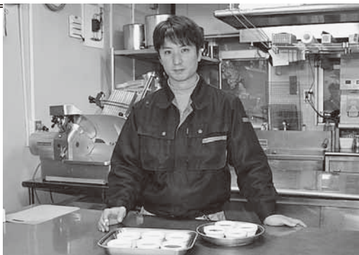
現在、農作業の合間を縫って、スターライトホテルで芦別産の野菜を使った特産品の開発に取り組んでいます

今年は今までの活動内容に加え、地域ブランドや地場産品の開発・販売・PR等の地域おこし活動もしていきます。具体的な活動内容などは、また次回ご報告できればと思います。今後ともよろしくお願いたします！