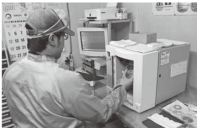
原料を粉碎した後に行われる精密粒度分布測定装置による測定・検査