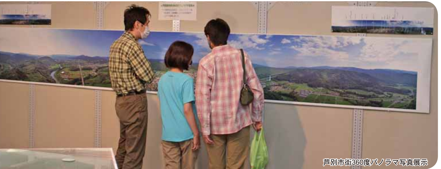
芦別市街360度パノラマ写真展示