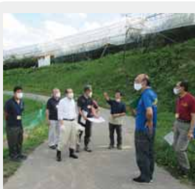
8月11日、台風4号が温帯低気圧に変わった影響による強風被害の現地視察調査を行いました。

8月は台風の発生が多い月でしたが、中でも、7日の台風4号が温帯低気圧に変わった影響で、道内では日本海側を中心に暴風や大雨がもたらされ、本市も暴風によって市内の公園や街路樹等の倒木や農家のビニールハウスの損壊などが発生したことから、被害の調査、視察を行ったところ