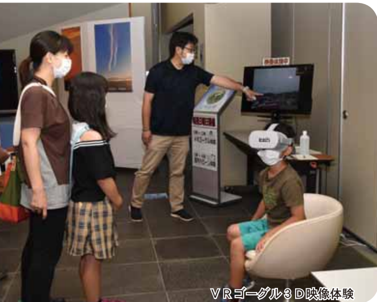
VRゴーグル3D映像体験