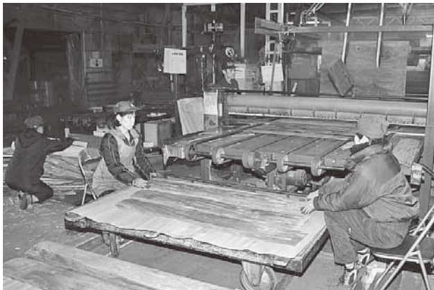
丸太から大根のように柱むきされた板を裁断。木目の美しさにこだわり、一枚一枚が人の目によって確認される