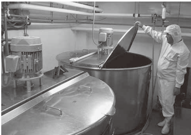
たれを調合、かくはんするタンク。一般の方の工場内見学も可能で、事前に連絡すれば随時受け付けているそうです