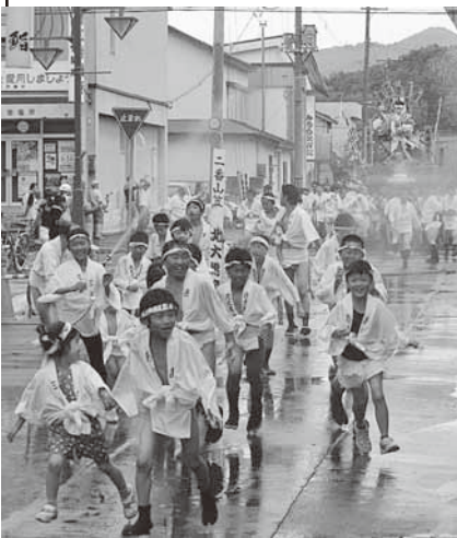
子どもたちも「勢い水」を浴びて 懸命の走り「北大黒流」(上) 最後の力を振り絞る「緑幸流」(右)

初日の芦別健夏山笠「追い山」。今年も3本の山が 出場し、沿道を埋めた観客からの熱い声援を受け ながら、市内を勇壮に駆け抜けました。このタイ ムレースを制したのは「栄流」(写真上)