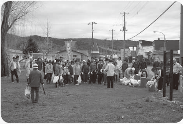
市民の皆さんによるごみ減量化の取り組みとともに、自発的な活動でマチの環境が守られています(親子一斉クリーン作戦)