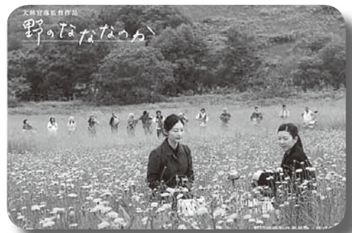
◎「野のなななのか」製作委員会/PSC

◎チケット販売取扱所=芦別観光協会(市役所2階)、道の駅(観光物産センター)、一の薬局、大山ふとん店、タカセ時計店、製作委員会事務局