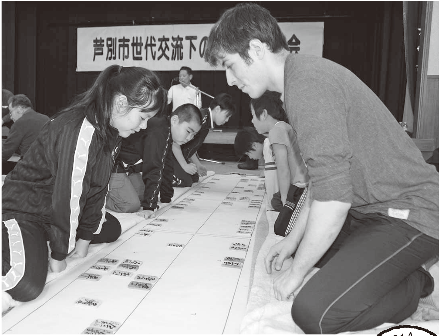
1月18日、総合福祉センターで「世代交流下の句かるた」大会が開催されました。小学生も大勢参加し、真剣な表情で札に向き合っていました。