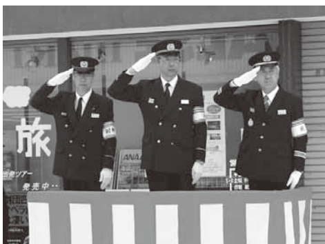
1月5日の消防出初式。災害がなく、市民の安心安全な暮らしを守ることを誓いました

新年を迎え、今年も多くの会合にお招きをいただきました。公務の合間を縫ってできる限り参加させていただき、多くの方々との懇親を深めながら、市政に対するご提言もいただいたところです。