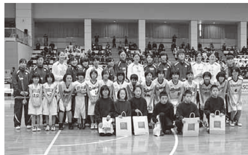
試合前のセレモニーで、芦別市などジュニアの選手が記念撮影

当日は、芦別市内や滝川市の小学生、中学生による前座試合が生まれ、雰囲気盛り上げるのに一役買いました。その後の公式試合では、華やかな応援合戦が繰り広げられるなど、集まった約800人の観衆は、プロスポーツの醍醐味を堪能していました。