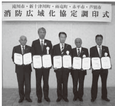
滝川市・新十津川町・雨竜町・赤平市・芦別市 消防広域化協定調印式

▼消防署からのお知らせ 滝川地区広域消防事務組合 平成26年4月1日に正式 加入します