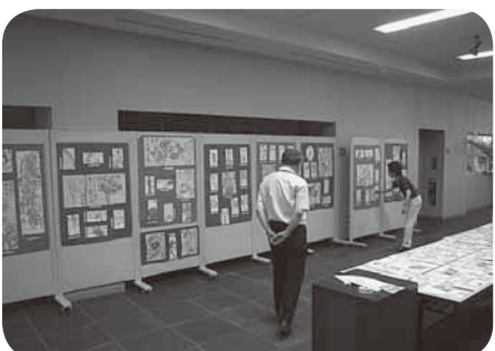
星の降る里百年記念館で 8月4日まで開催されて いる絵手紙展

市内に住む女性25人でつくるサークルです。「へたがいい、へたでいい」をモットーに楽しく作品づくりを行っています。野菜や草花など身近なものを淡い色彩で描き、春の訪れや収穫の喜びなどを表現した言葉が添えられています。