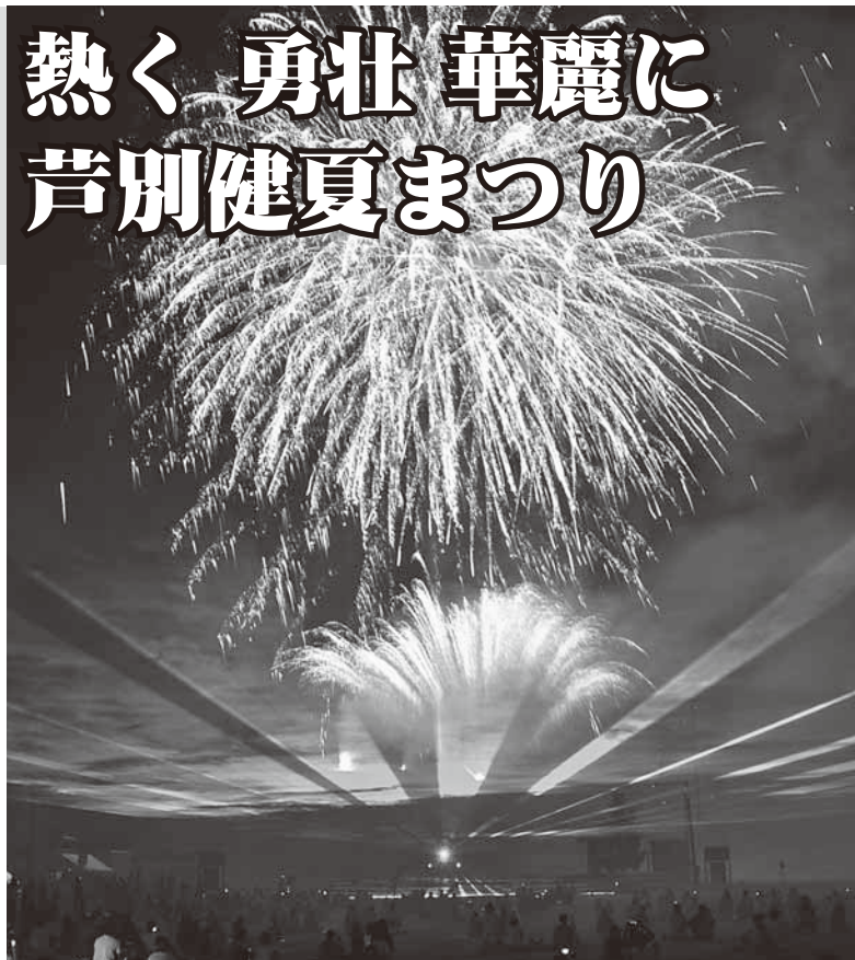
国設芦別スキー場の斜面から打ち上げられた花火。今年はレーザー光線と音楽との競演