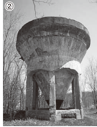
①油谷町「旧油谷炭鉱選炭機跡」②西芦別町「旧三井芦別選炭機原炭ポケット」③なまこ山総合運動公園パークゴルフ場裏の空知川沿い「旧三菱専用鉄道橋脚跡」