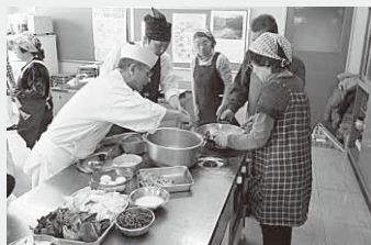
「ガタタン作り講座」