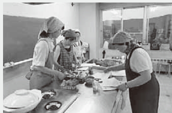
「ヘルシークッキング教室」

ラダ」など、普段家で作る料理とは一味違ったヘルシーな4種の献立を作りました。盛り付けにも参加者それぞれの個性が出ていて楽しい講座となりました。