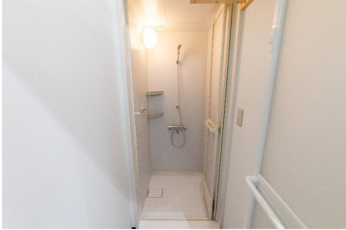
シャワールーム(その2)