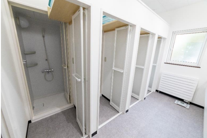
シャワールーム(その1)